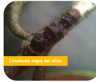
Conchuela negra del olivo