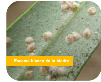
Escama blanca de la hiedra